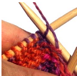
Doppelte Masche (Rückreihe)